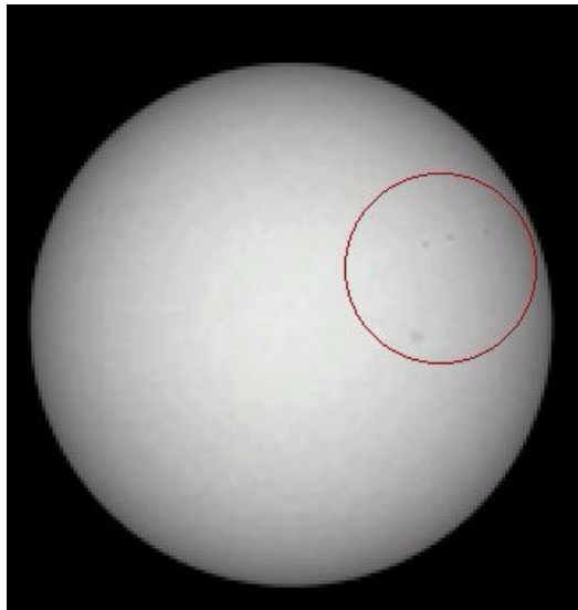
FIG. 3: Astrofotografia obtida por uma aluna por meio do micro observatório robótico da NASA-Harvard Smithsonian. No canto superior à direita podemos ver pequenas manchas solares.

observar a superfície solar, descobrindo as chamadas “manchas solares”, os alunos fizeram o mesmo com os seus recursos tecnológicos atuais, programando os microobservatórios do Observing with Nasa para astrofotografar o sol. Assim, séculos depois, não somente ouviram falar da observação de Galileu, como a repetiram e puderam constatar a presença das manchas descritas.